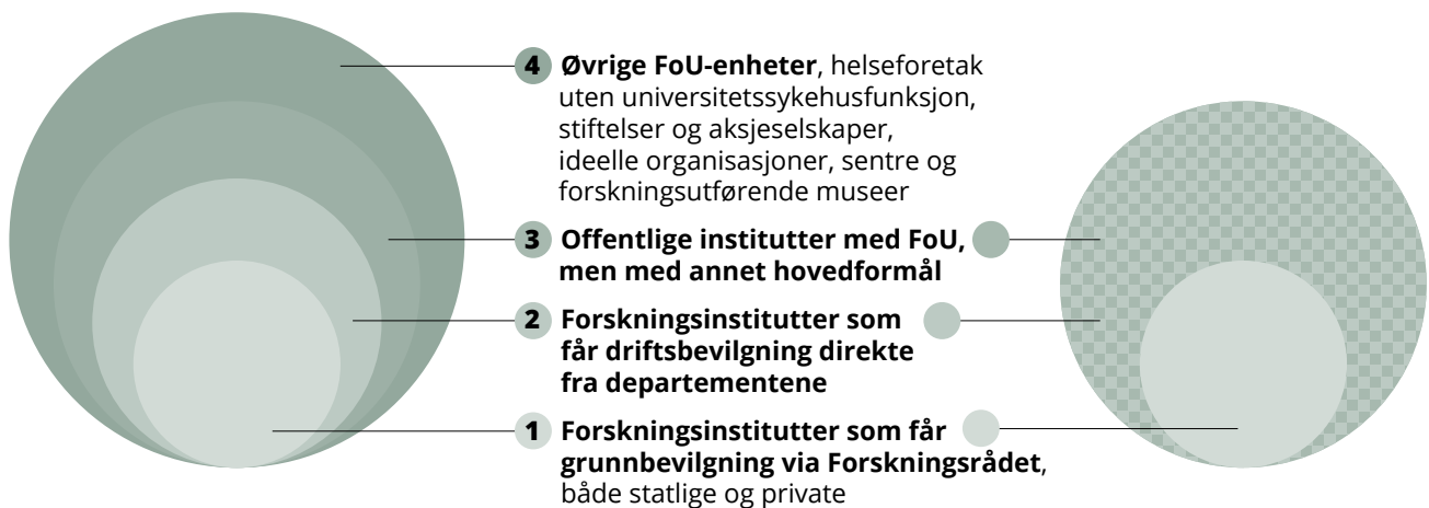
Figur 2 Sirkelen på høyre side viser hvem instituttpolitikken gjelder for.